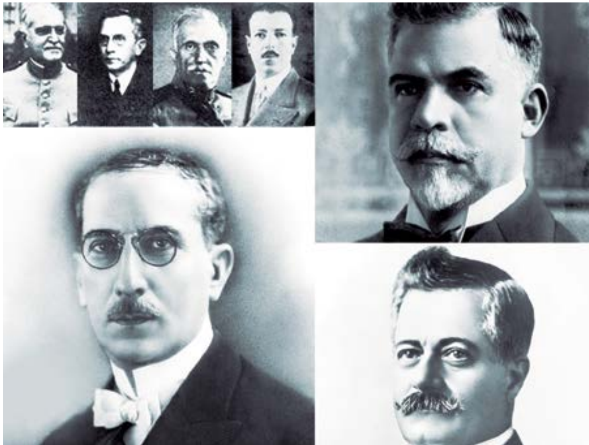
Nome dos presidentes: (Da esquerda para a direita)