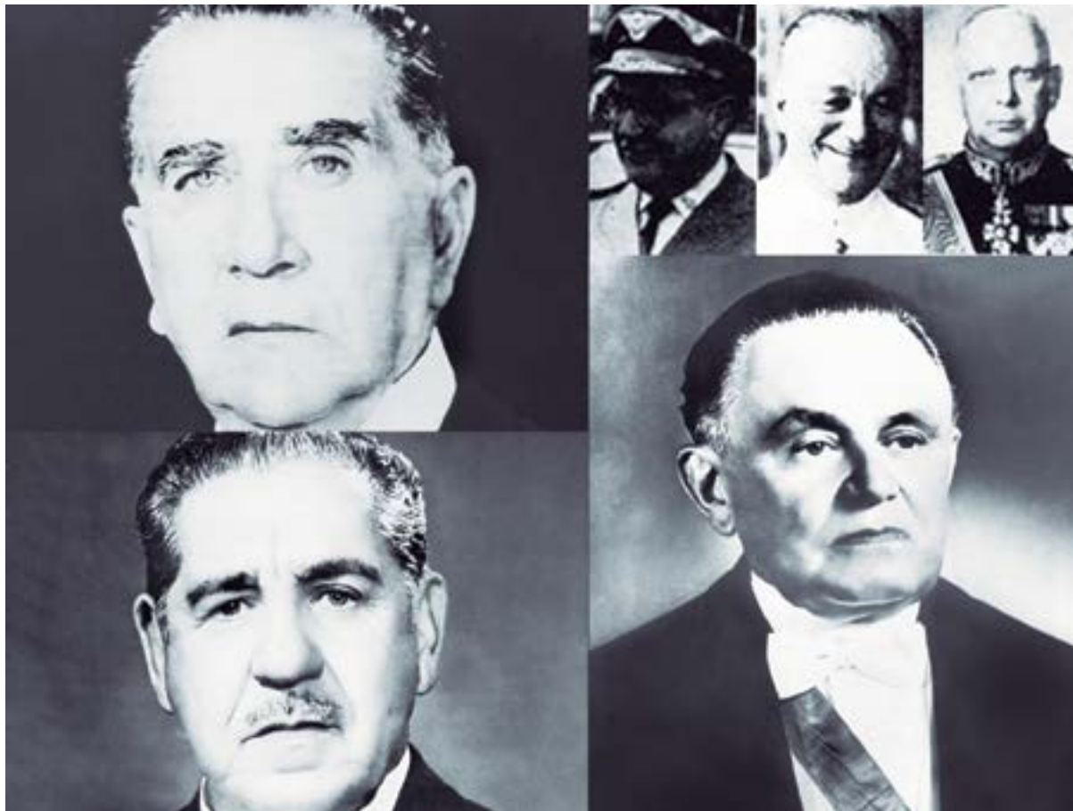
Nome dos presidentes: (Da esquerda para a direita)