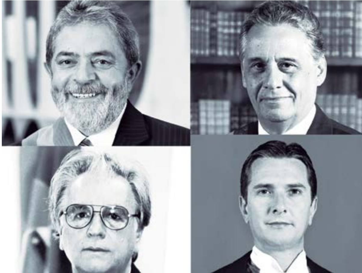
Nome dos presidentes: (Da esquerda para a direita)