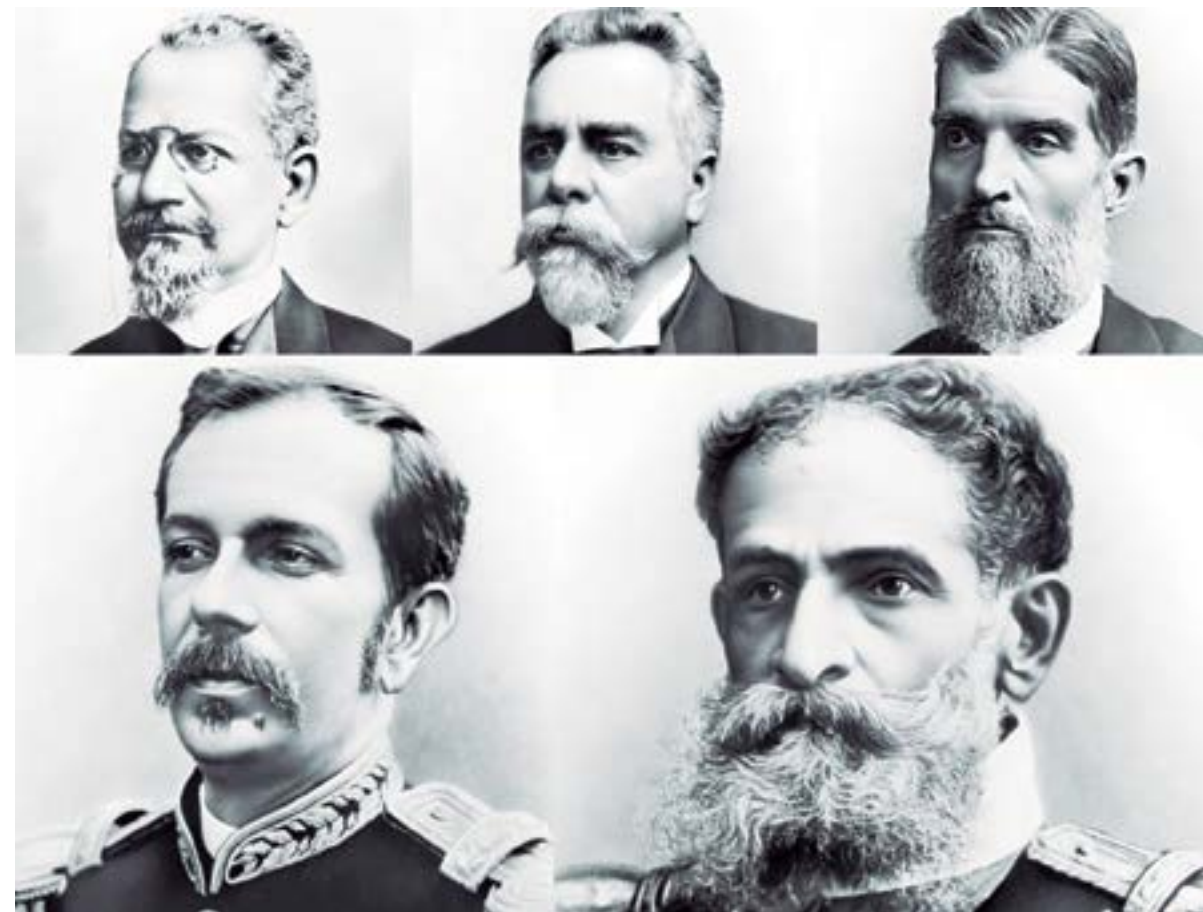
Nome dos presidentes: (Da esquerda para a direita)