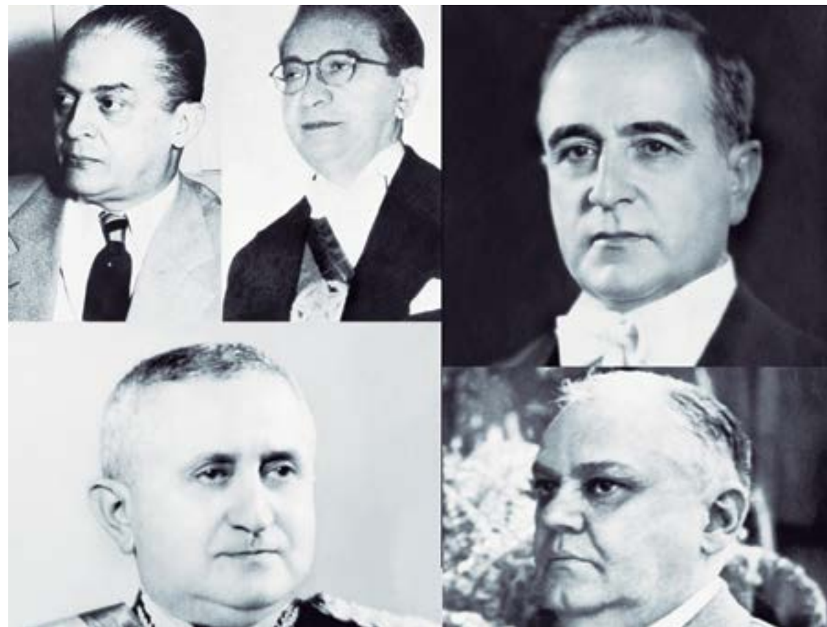
Nome dos presidentes: (Da esquerda para a direita)