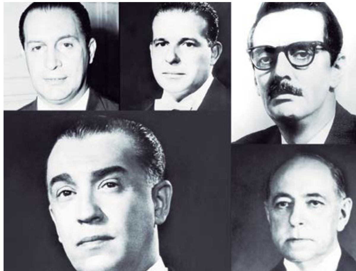
Nome dos presidentes: (Da esquerda para a direita)