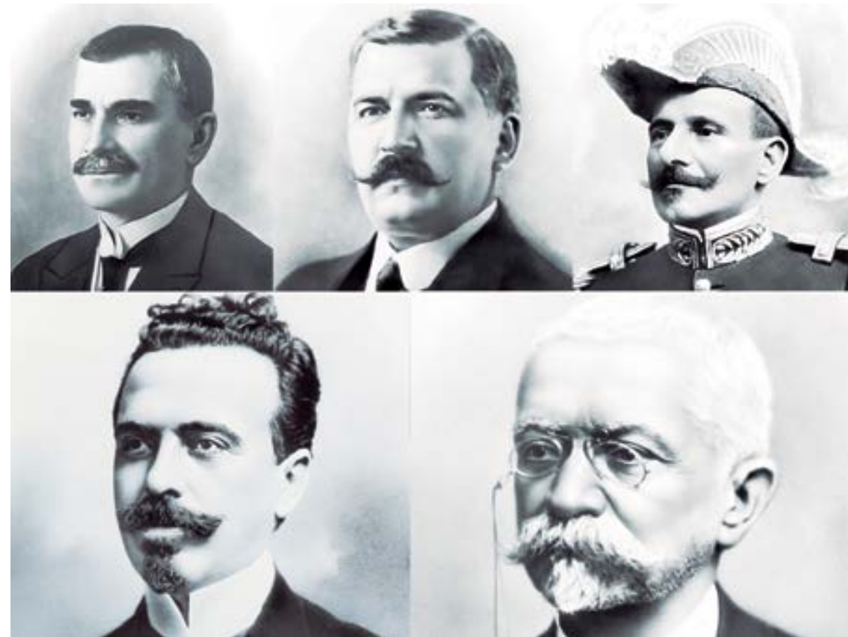
Nome dos presidentes: (Da esquerda para a direita)

16. Último dia para candidatos e comitês financeiros que disputam o segundo turno arrecadarem recursos e contraírem obrigações, ressalvada a hipótese de arrecadação com o fim exclusivo de quitação de despesas já contraídas e não pagas até esta data.